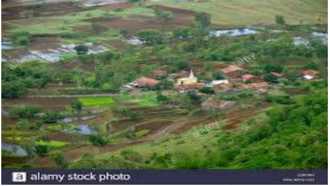
village and agricultural land ...alamy.com