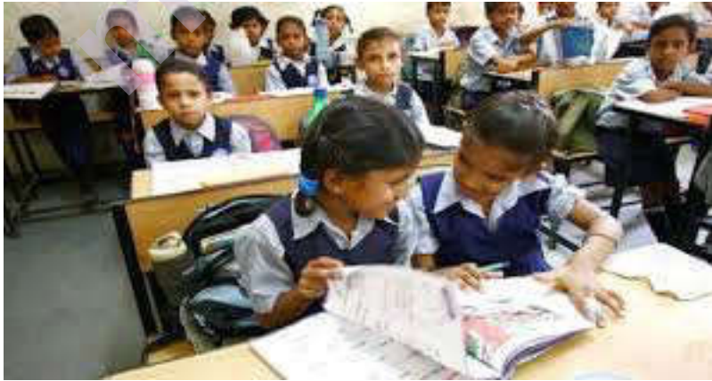
education initiatives taken by the govt ... indiatoday.in

भारतीय संस्कृतीने परंपरेने शिक्षण आणि संबंधित संस्थांकडे शिक्षणाची मंदिरे म्हणून पाहिले आहे. स्वातंत्र्यानंतर, प्रथम सार्वजनिक आणि सरकारी निधीद्वारे आणि नंतर खाजगी निधीद्वारे आम्ही आमच्या शाळा आणि महाविद्यालयांचे आधुनिकीकरण केले. 20 व्या शतकाच्या अखेरीस, भारतातील वाढत्या विद्यार्थीसंख्येतील शिक्षणाची वाढती मागणी पूर्ण करण्यासाठी मोठ्या संख्येने सार्वजनिक आणि खाजगी संस्था स्थापन करण्यात आल्या होत्या. परंतु, सर्वांसाठी शिक्षण देण्याच्या प्रयत्नात, फार कमी संस्थांनी गुणवत्ता आणि मूल्ये दोन्ही टिकवून ठेवल्या आहेत. जे पारंपारिक भारतीय शिक्षणाचे वैशिष्ट्य होते. मूलभूतपणे मजबूत उच्च शिक्षण हे राष्ट्राच्या समृद्धीशी संबंधित आहे. अनेक जागतिक नेत्यांनी भारतीय विद्यार्थी गणित आणि विज्ञानात चांगले असल्याकडे लक्ष वेधले आहे.