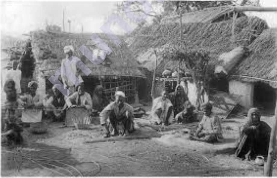
Caste – Wikipedia...en.wikipedia.org

त्यांना अनेक सार्वजनिक अपमानांना सामोरे जावे लागले कारण त्यांना विहिरी, सार्वजनिक वाहतूक, शैक्षणिक संस्था या सार्वजनिक सुविधांचा वापर करण्याचा अधिकार नाकारण्यात आला होता.