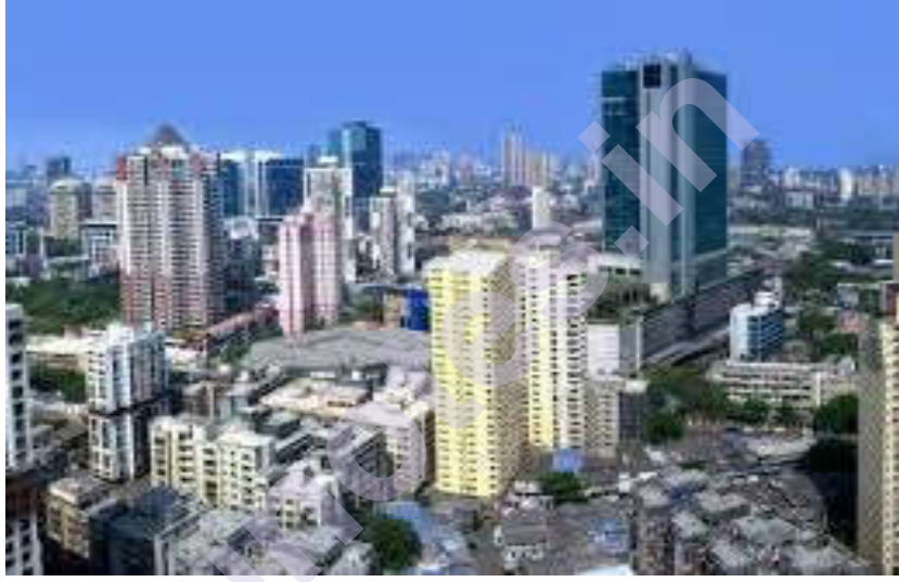
Mumbai Tourism | Mumbai Tourist Places ...india.com