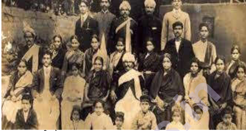
सहजासहजी सोडायला तयार नसतात.