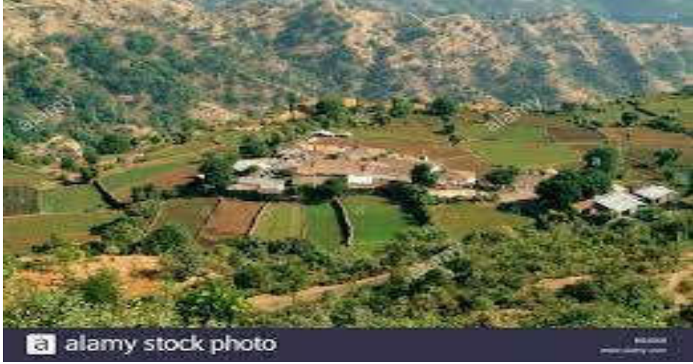
Maharashtrian countryside, India

मध्ययुगीन काळात गावे मोठ्या प्रमाणात स्वयंपूर्ण होती. जातीव्यवस्था, संयुक्त कुटुंब व्यवस्था, बलुतेदारी व्यवस्था या घटकांनी महत्त्वाची भूमिका बजावली. आधुनिक काळात ग्रामीण जीवनाचे स्वावलंबीत्व प्राप्त केले आहे. एकाच ठिकाणी राहणे अथवा एकाच समाजात राहणे हे दृश्य आता बदलले आहे. औद्योगिकीकरण आणि जागतिकीकरणामुळे ग्रामीण भागातील लोकांच्या जीवनशैलीत बदल झाला आहे.